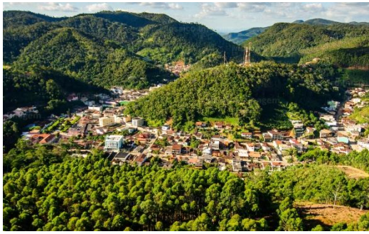
Ciudad de Santa Teresa/ES

FCCA realizara la Etapa "1Adventure South America World Cup" - "BRASIL 1Adventure Racing National Series" en la región de sierra de Espírito Santo (ES), con sede en el municipio de Santa Teresa/ES y el recorrido pasa por los municipios de Santa Leopoldina/ES y Santa Maria de Jetibá/ES, región conocida como "dos Imigrantes". Santa Teresa/ES fue la primera ciudad de la colonización italiana en Brasil. Santa Leopoldina/ES inicialmente tuvo inmigrantes suizos, alemanes y austriacos. Santa María de Jetibá/ES tuvo colonización pomerania y alemana.