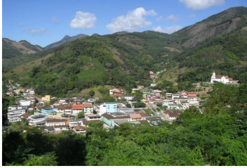
Ciudad de Santa Leopoldina/ES