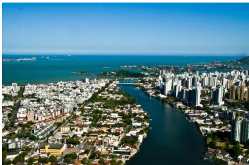
Ciudad de Vitória/ES (aeropuerto VIX)

La ciudad turística de Santa Teresa/ES está a sólo 78 km del aeropuerto VIX (Vitória/ES), aproximadamente 1:20 h en autobús, por las carreteras BR-101 y ES-261, y con la sede (salida) en 675 metros sobre el mar. de nivel y con una altitud máxima de 1083 m. Santa Leopoldina tiene su sede a 17 m sobre el nivel del mar, por estar ubicada en un valle formado por la cuenca hidrográfica del río "Santa María" y una altitud máxima de 915 m. Santa Maria de Jetibá tiene su sede a 720 m sobre el nivel del mar y una altitud máxima de 1450 m en la "Pedra do Garrafão", y la ciudad también cuenta con un Jardín Forestal (reserva de preservación) y varias cascadas en su municipio. "