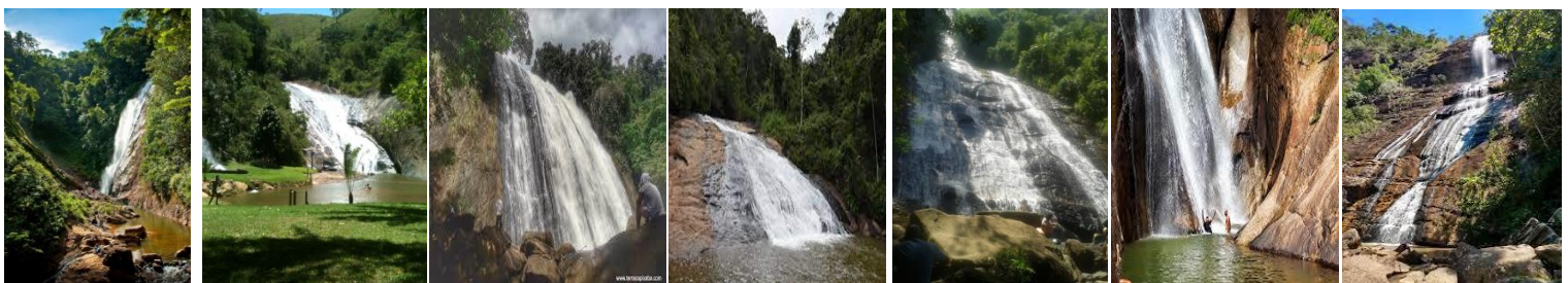
"Véu de Noiva" "Rio do Meio" "do Palito" "de Holanda" "do Galo" "Moxafongo" "Country Club"

La etapa contará con Ciclismo de Montaña, Trail Run, Canotaje y dos pruebas verticales especiales con "Rapelling" en cascadas, y navegación mediante un mapa topográfico sobre lienzo de colores impreso en alta resolución, en un recorrido de aproximadamente 200 km a 210 km. Se espera que dure de 24h a 30h, pasando por regiones montañosas y el circuito de "cascadas", se espera que pase por 6 a 7 cascadas diferentes.